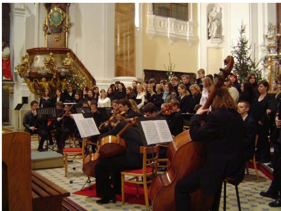
Vánoční koncert v chrámu Nanebevzetí Panny Marie v Dubu na Hané.