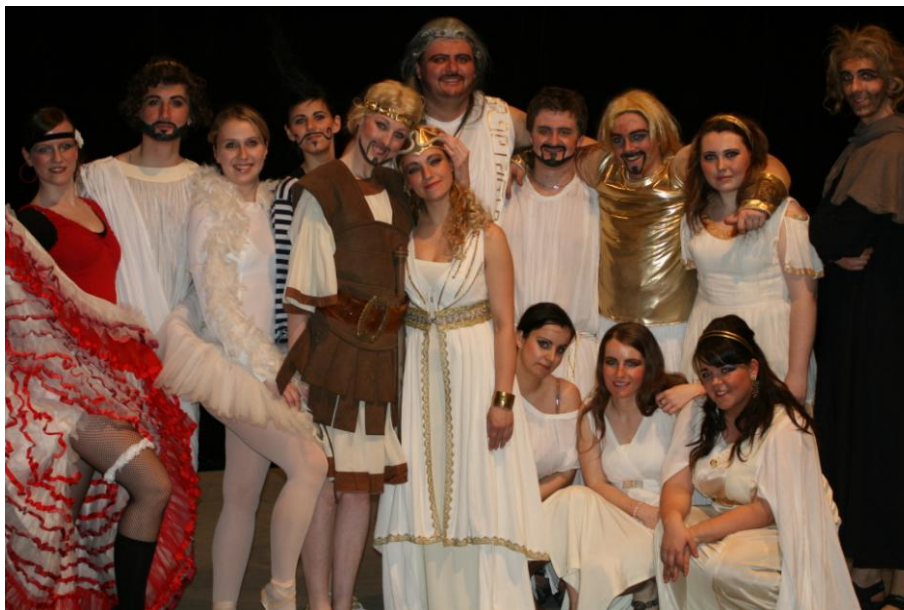
Snímek ze scénického představení J. Offenbacha – Krásná Helena v Domě kultury Kroměříž.