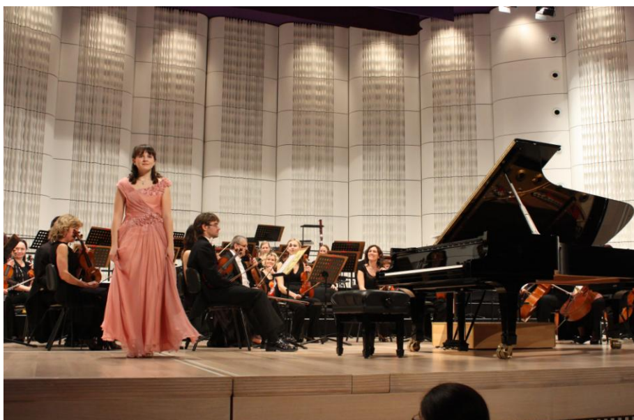
Potěšil nás velký ohlas vyprodaného hlediště Kongresového centra Zlín a nabídka na pravidelnou spolupráci s FBM Zlín při realizaci společných koncertů.